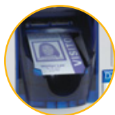
Ausgabefach für bis zu 9 Karten