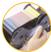
Einfacher Austausch der Farbbandkassette