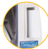
Integrierter Kartenhalter für bis zu 15 Karten

Der Datacard® SP25 ist der einzige Kartendrucker auf dem Markt, der in der Standardausführung Vollfarb-/Monochromdruck und den Druck auf wiederbeschreibbaren Karten ermöglicht.