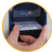
Zuführung von Einzelkarten