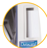
Integrierter Kartenhalter für bis zu 15 Karten

Der Datacard® SP25 ist der einzige Kartendrucker auf dem Markt, der in der Standardausführung Vollfarb-/Monochromdruck und den Druck auf wiederbeschreibbaren Karten ermöglicht.